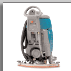
Prosta obsługa maszyny