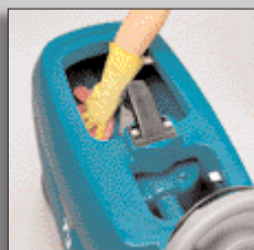
Łatwe w czyszczeniu zbiorniki