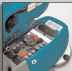
Długi czas pracy baterii