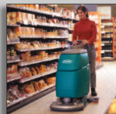
Maszyna podczas pracy